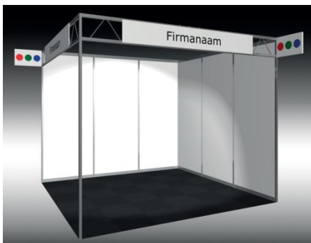
Voorbeeld opstelling standaard standbouw 9m 2 hoekstand